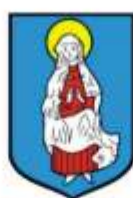
GMINA JANÓW LUBELSKI