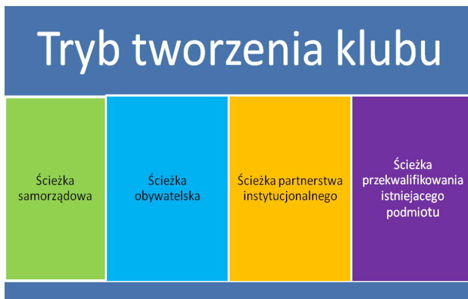
Rys.1 Tryb tworzenia klubu integracji społecznej

polegający na przekształceniu już istniejących podmiotów jak gminne centrum informacji lub klub pracy.